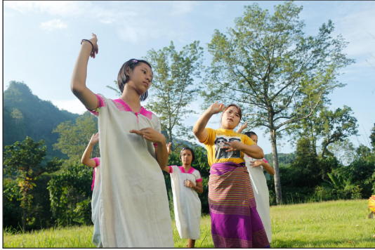
ภาพที่ 18 ฝึกซ้อมการแสดงรำตงผู้หย่องแห่งก่อนบันทึกวีดิโอ และบันทึกภาพทำรำ

9. ด้านการแปลแถวพบว่า ในการแสดงมีลักษณะการแปลแถว 2 รูปแบบ ได้แก่ ลักษณะแถวหน้ากระดาน 4 คน ต่อลงไปเป็นตอนลึก 4 คน และลักษณะแถววงกลม 4 วง วงละ 4 คน