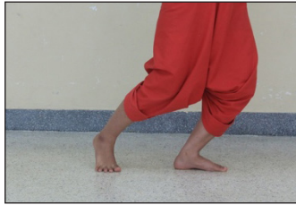
ภาพที่ 12 การก้าวข้าง