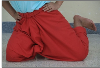
ภาพที่ 10 การกระดกเท้า