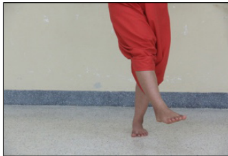
ภาพที่ 7 การเตะเท้า

การย่ำเท้า เป็นลักษณะของการใช้จมูกเท้า วางลงบนพื้น โดยยกส้นเท้าให้ลอยขึ้นจากพื้นเล็กน้อยทำสลับกันทั้ง 2 ข้าง