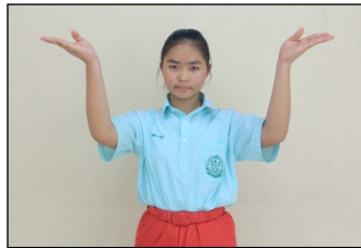
ภาพที่ 5 การตั้งวงบัวบาน

การตั้งวง เป็นลักษณะการใช้แขนข้างใดข้างหนึ่ง หรือแขนทั้ง 2 ข้างงอข้อศอกเล็กน้อย ตั้งข้อมือขึ้นนิ้วทั้ง 4 นิ้วเรียงชิดติดกัน นิ้วหัวแม่มือหักไปด้านหน้า คือ การตั้งวงบน