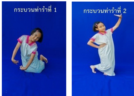
ภาพที่ 17 ท่ารับลักษณะที่ 4