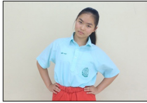
ภาพที่ 2 การกอดไหล่

การกอดไหล่ เป็นลักษณะของการใช้ไหล่ให้ สอดคล้องกับการเอียงศีรษะ เพื่อให้เกิดความความสวยงาม