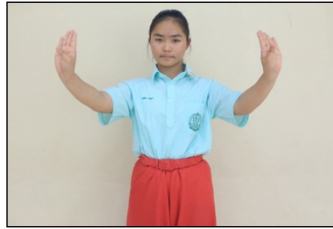
ภาพที่ 4 การตั้งวงบน