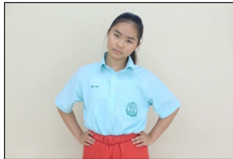
ภาพที่ 1 การเอียงศีรษะ

การเอียงศีรษะ เป็นลักษณะการใช้ข้อว้ายวะ ส่วนของศีรษะเอียงไปด้านซ้ายและด้านขวา