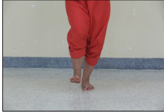
ภาพที่ 6 การย่ำเท้า