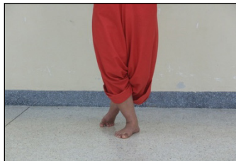
ภาพที่ 11 การก้าวเท้า

การกระดกเท้า เป็นลักษณะการยกเท้าไปข้างหลัง พยายามให้ส้นเท้าชิดกับก้นโดยการถีบขาที่กระดกไปข้างหลังมาก ๆ มีลักษณะคือ แบบนั่ง