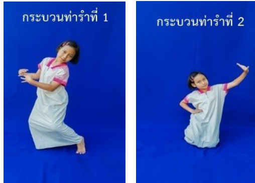
ภาพที่ 16 ท่ารับลักษณะที่ 3