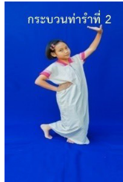
ภาพที่ 15 ท่ารับลักษณะที่ 2